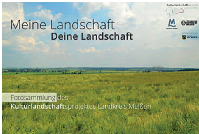
Meine Landschaft, Deine Landschaft – Ein Aufruf des Kulturlandschaftsprojektes Landkreis Meißen