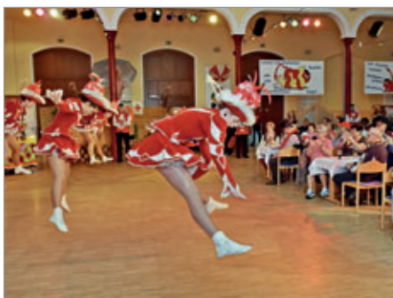
Am Samstag, dem 15. Februar um 16:00 Uhr im Schützenhaus Lommatzsch, Veranstaltungs Auftakt mit dem Rentnerfasching.